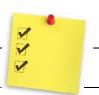
TABLEAU SYNTHÈSE FRAIS DU SERVICE DE GARDE