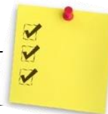
TABLEAU SYNTHÈSE FRAIS DU SERVICE DE GARDE